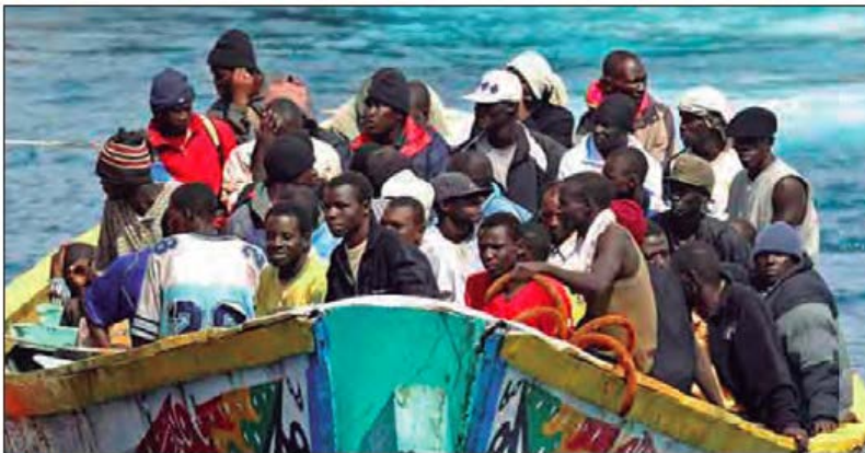
■ Inmigrantes africanos con destino a España o Italia.

“En el contexto de la globalización, en que la economía se ha deslocalizado y se han ampliado los intercambios comerciales, el flujo migratorio también ha aumentado, ocasionando diferentes efectos tanto en los lugares de origen como de destino de quienes deciden cambiar su lugar de residencia habitual por otro. Además, la grave situación económica en países de África y el Oriente Medio, agravado por conflictos bélicos en la zona, ha llevado a que los inmigrantes de estas regiones del mundo presionen cada vez, en mayor número, las fronteras europeas. Algo similar ocurre con la gran cantidad de personas que por razones económicas emigran de América Latina a Estados Unidos.” (Mineduc, 2017, p. 131).