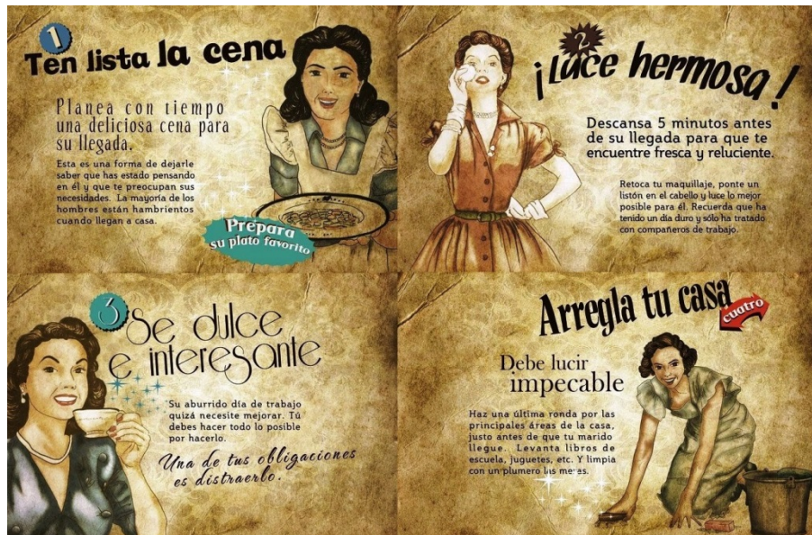
Figura 6. Guía de la buena esposa