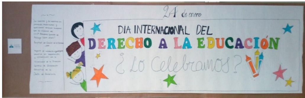
Figura 2. Cartel anunciador de la exposición de pósters realizados por el alumnado de 3º de Grado de Primaria (UMA) para celebrar el Derecho a la Educación en el CEIP Almudena Grandes (Málaga)

celebrada en CEIP Almudena Grandes. De esa manera, cada subgrupo aportó una perspectiva a la exposición general y un buzón de sugerencias creado exprofeso para que el alumnado de quinto de primaria pudiera contribuir con sus impresiones.