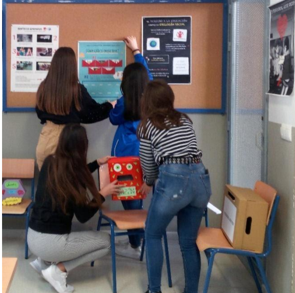
Figura 4. Alumnas de 3º de Grado de Primaria (UMA) durante el montaje de la exposición.

tomaron en consideración que su propuesta introducía un concepto que podía resultar especialmente abstracto para los alumnos de 5º del CEIP Almudena Grandes. A modo de ejemplo hay que mencionar que un equipo de maestras en formación se propuso informar/documentar sobre la ratio y su relación con el Derecho a la Educación.